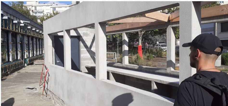
Salles (en enfilade) et Kiosque