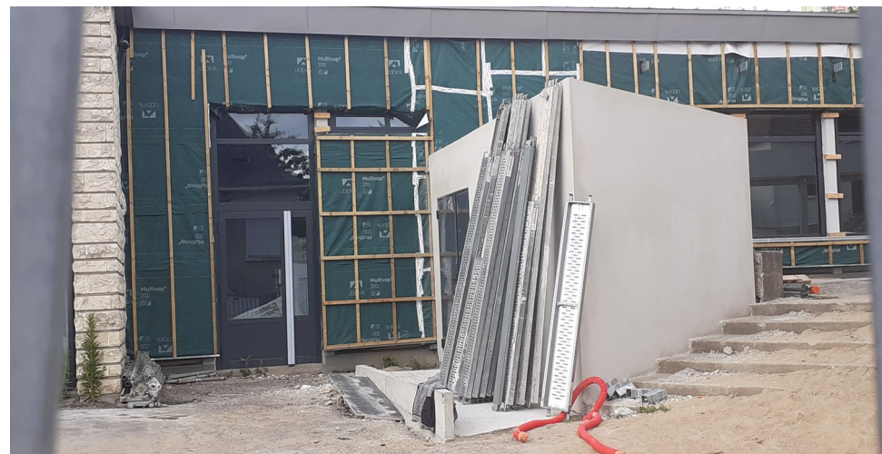
Entrée Principale & Toilettes Publiques